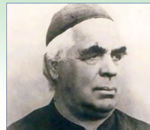
Initiator der Kneipp Bewegung Pfarrer Sebastian Kneipp (1821-1897)