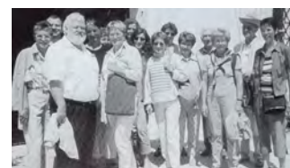
Kursleitertage einst und heute